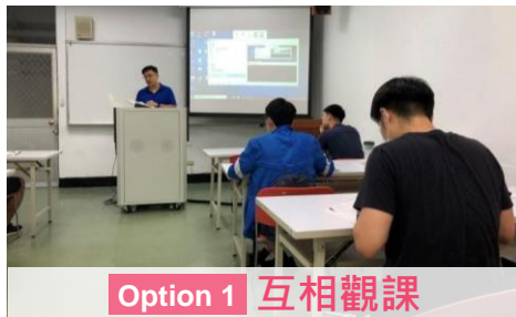
Option 1 互相觀課