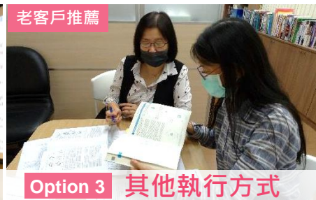
Option 3 其他執行方式