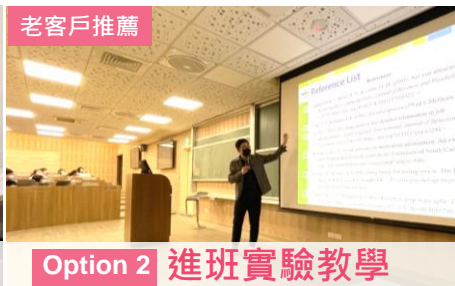
Option 2 進班實驗教學